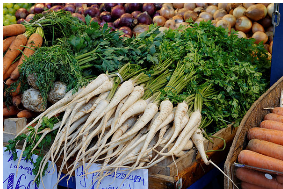
Wurzelpetersilie auf einem Markt in Budapest

Die Wurzelpetersilie ( Petroselinum crispum subsp. tuberosum ), auch Knollenspetersilie oder Petersilienwurzel genannt; in Österreich auch Peterwurz, ist eine Unterart der Petersilie ( Petroselinum crispum ) mit verdickter, länglich, spitz zulaufender Rübe . Sie gehört zur botanischen Familie der Doldenblütler (Apiaceae).